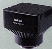
Digital Sight 10 PC セット 【186万円～】