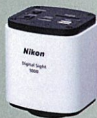
Digital Sight 1000 モニタセット 【18万円～】