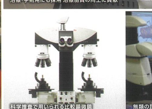
科学捜査で用いられる比較顕微鏡