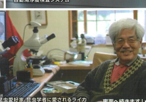
無類の昆虫愛好家、昆虫学者に愛されるライカ