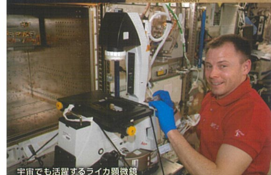
宇宙でも活躍するライカ顕微鏡