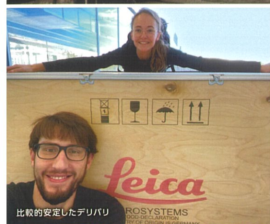
比較的安定したデリバリ

ROSYSTEMS GOOD DECLARATION TRY OF ORIGINAL GERMANY