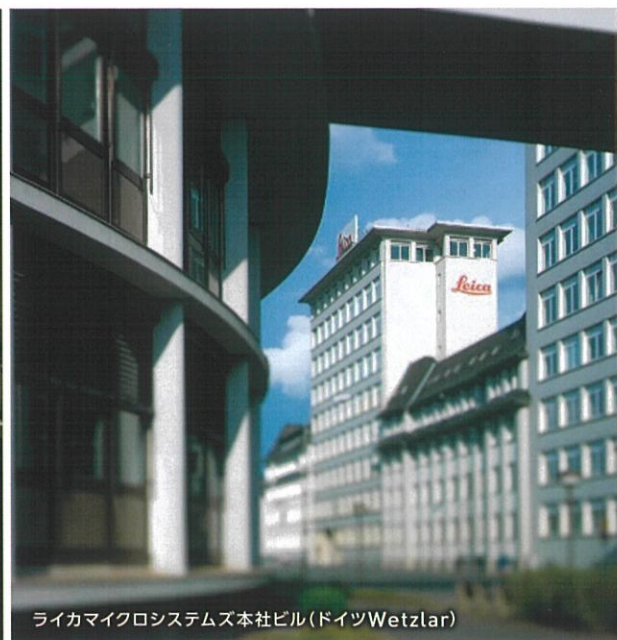
ライカマイクロシステムズ本社ビル(ドイツWetzlar)