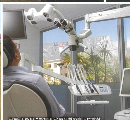
治療・手術用にも採用 治療品質の向上に貢献

ROSYSTEMS GOOD DECLARATION TRY OF ORIGINAL GERMANY