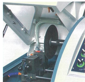
試料クランプが容易な左側片持ちバイス方式