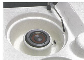
オーバーフロー防止の深堀槽