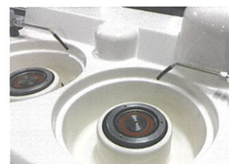
密閉型大型ベアリング