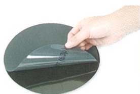
研磨盤の交換が楽々!