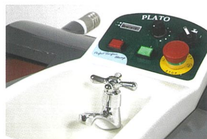
試料洗浄に便利な流し台付