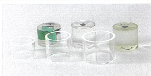
埋込用クリアカップ 15mm 高さクリアカップ (左端)