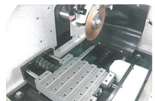
横移動セット (特別付属品)