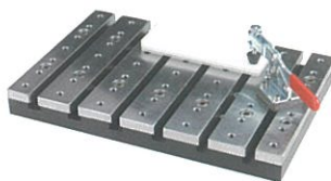
ホールドダウングルクランプ