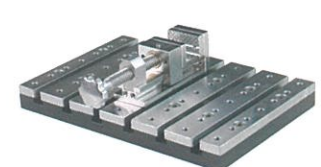
スクリューバイス