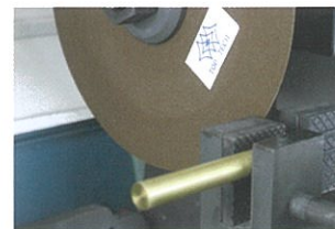
左右セバレートバイス