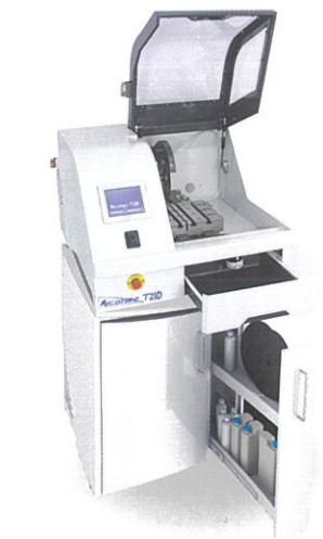
専用台に載せると工具、砥石の取り出しが便利になります。