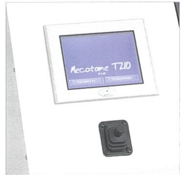
シンプルな操作で切断作業のストレスを軽減。