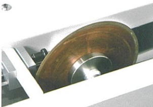
ドレッシング装置付 (標準付属品)