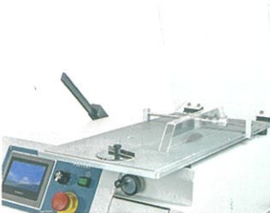
カッティングテーブル (特別付属品)