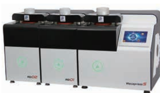
メカプレス5+マウンティングユニット2台