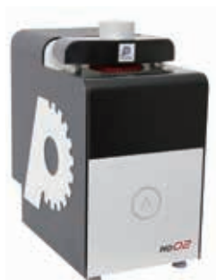
マウンティングユニット