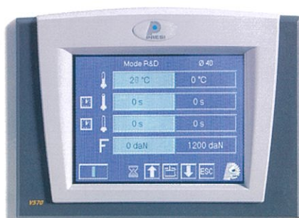
操作性の良いタッチパネル